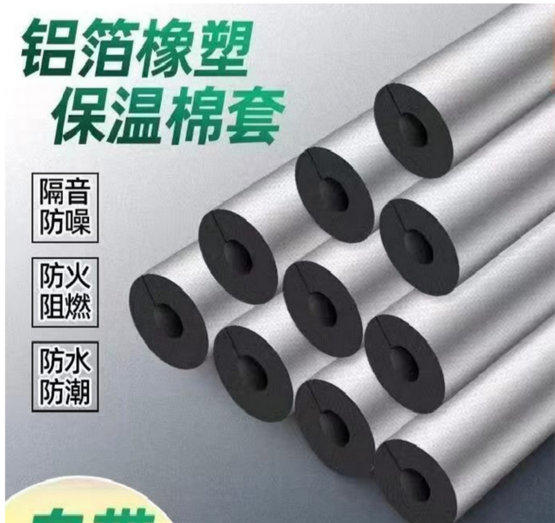
开口自粘式铝箔橡塑保温棉管套